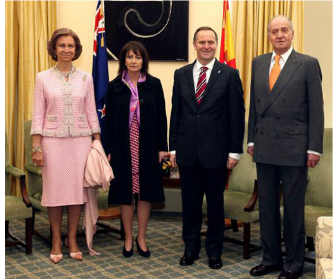
Los reyes de España, con el primer ministro, John Key, y su esposa, Bronagh Key, en el Parlamento de Nueva Zelanda, durante la visita que realizaron al país en el año 2009.

Ministro de Comercio y Asuntos de los Consumidores