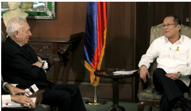
José Manuel García-Margallo, durante el encuentro con el presidente de Filipinas, Benigno Aquino, celebrado en Manila en marzo de 2014.

los productos químicos orgánicos (ácidos nucleicos y sales de amonio cuaternario, probablemente para agricultura), y los aparatos y material eléctricos.