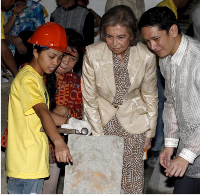
S.M. la Reina atiende a las explicaciones de una joven filipina, durante su visita a una escuela taller financiada por España en Manila, durante su visita en julio de 2012.