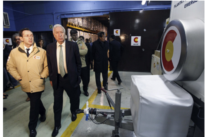
El ministro de Asuntos Exteriores y de Cooperación, José Manuel García-Margallo, junto al secretario general de Cooperación, Gonzalo Robles, supervisan el primer envío de ayuda humanitaria a Filipinas por el tifón "Yolanda" en noviembre de 2013.