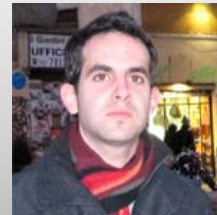
Ricardo Alcalde CMS código abierto