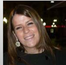
Alicia Pac Posicionamiento en buscadores