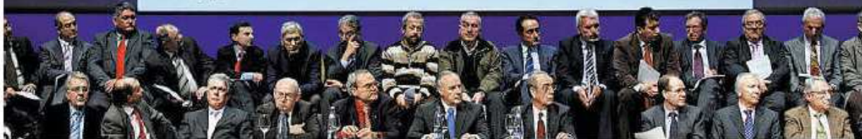
Los convocantes y los representantes de las 54 asociaciones firmantes del manifiesto presiden la reunión