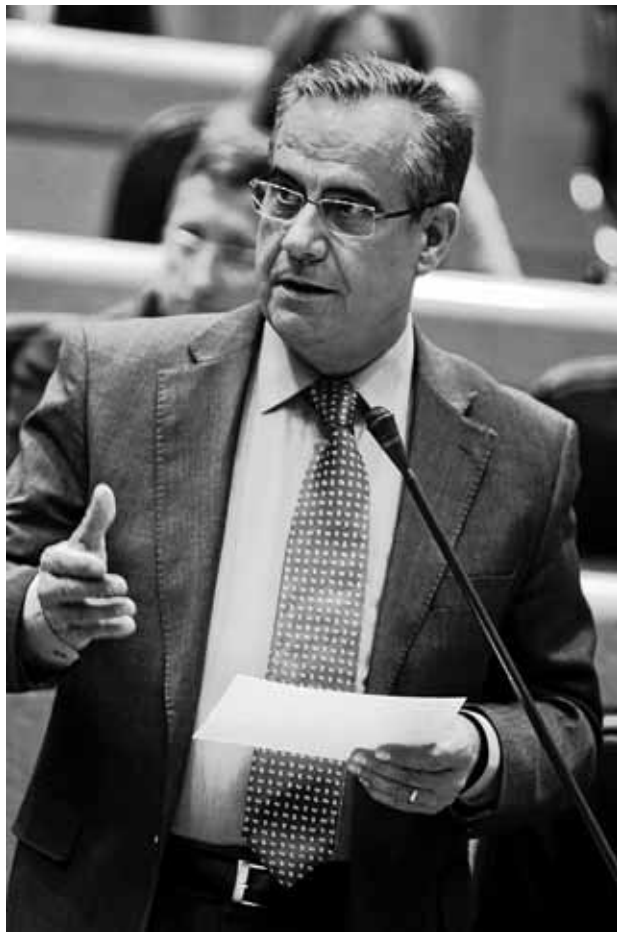
El ministro de Trabajo e Inmigración, Celestino Corbacho.

Incluso, Trabajo plantea la aplicación de esta medida sobre "los nuevos contratos de fomento del empleo indefinido, con carácter transitorio y excepcional". Es decir, que no