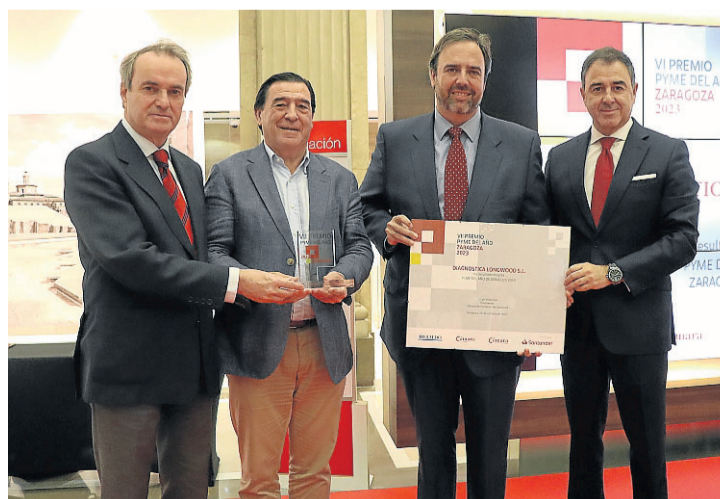
Entrega del Premio Pyme del Año a Diagnostica Longwood.

satisfacer las necesidades del profesional de laboratorio, especializándose con el paso de los años en el diagnóstico molecular. A través de la innovación, la mejora constante y la apuesta permanente por la integración de nuevas tecnologías, la empresa se ha convertido en la compañía líder en inmunología de trasplante.