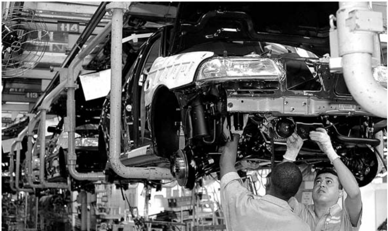
Dos operarios trabajan en una fábrica de automóviles en San Bernardo del Campo (Brasil).

La buena amistad comercial entre las dos economías comenzó en 1995, cuando