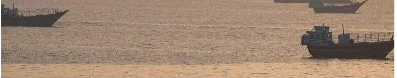
Imagen de archivo del estrecho de Ormuz.