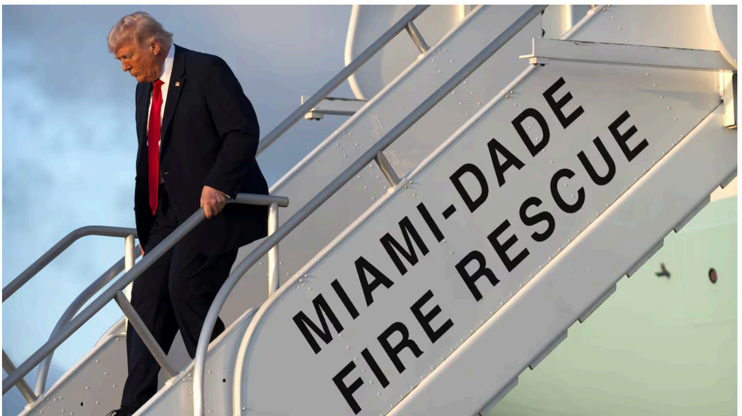
El presidente de Estados Unidos, Donald Trump.

Algunos comercializadores están remitiendo misivas a grandes consumidores invocando la cláusula legal 'rebus sic stantibus' para rescindir el suministro a los precios previamente firmados